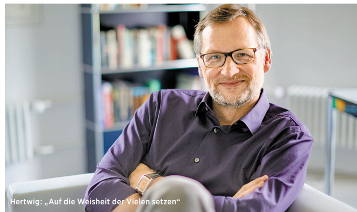
Hertwig: „Auf die Weisheit der Vielen setzen“

Hertwig: Ein gutes Beispiel dafür ist, wie man einen Ball fängt. Es ist ja keineswegs so, dass wir dazu eine Unmenge von Informationen über die Geschwindigkeit des Balles, seinen Spin, den Luftwiderstand und