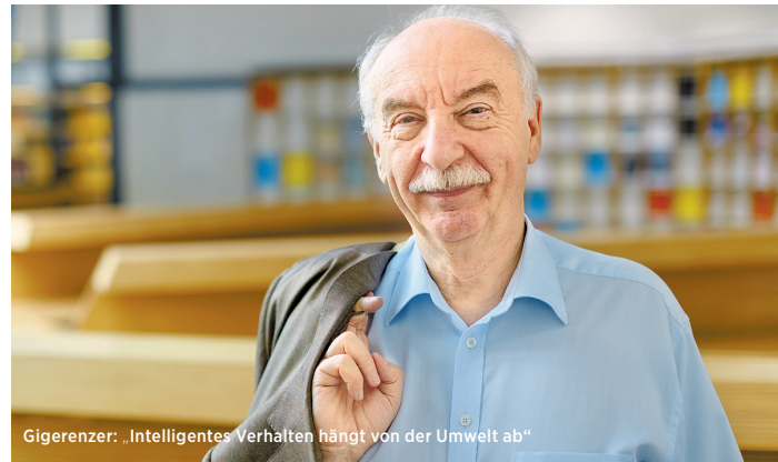
Gigerenzer: „Intelligentes Verhalten hängt von der Umwelt ab“

Unschuldsumsetzung für den Angeklagten. Oder auch für die Inkaufnahme möglicher Fehlalarme, wenn es um die Diagnose von hochgefährlichen Krankheiten geht. Ob eine Abweichung nützlich ist, hängt ab von der Umgebung und unseren Zielsetzungen. Das führt mich zu einem weiteren Punkt. Was mich an dem Fokus auf die kognitiven Fehlleistungen stört, ist: Diese Untersuchungen und Modelle konzentrieren sich ausschließlich auf die Erklärung von Problemen, die ihre Ursache in der menschlichen Psyche haben.